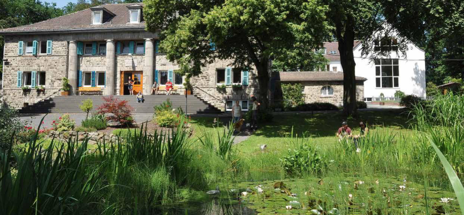
FKH Vielbach